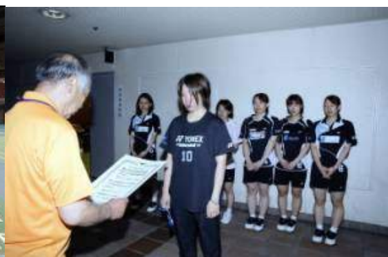
3位 岐阜トリッキーパンダース