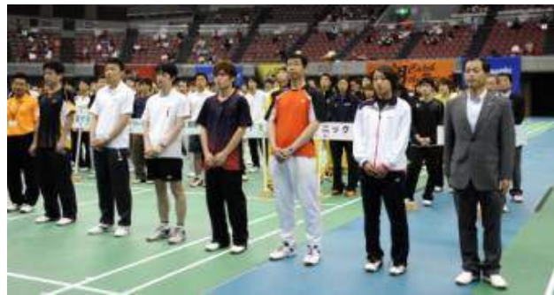
功労者表彰(団体の部)