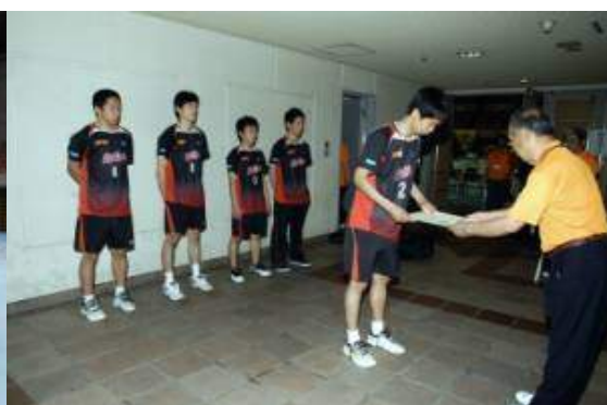
3位 NTT 東日本