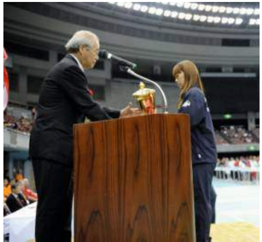
優勝杯返還(女子) パナソニック(大阪府)