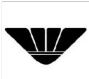
【日本実業団バドミントン連盟】