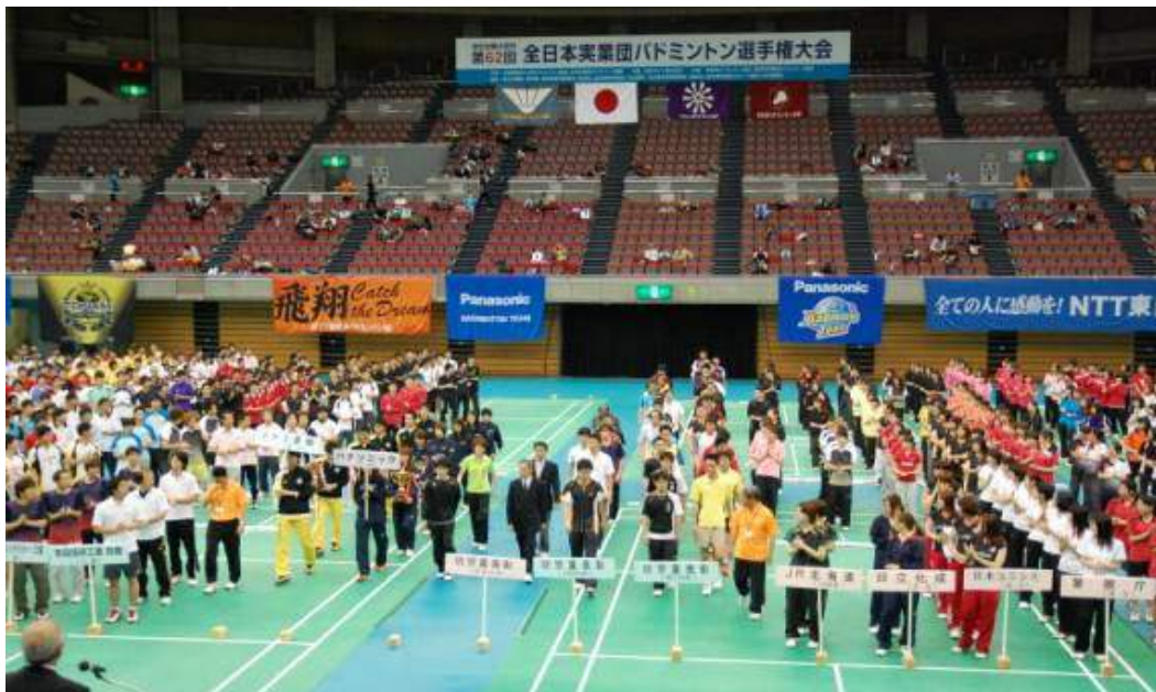
選手入場(表彰者入場)