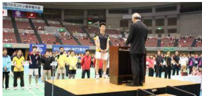
功労者表彰(個人の部)