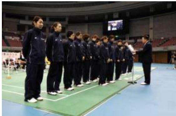
優勝 パナソニック