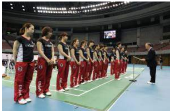
準優勝 日本ユニシス