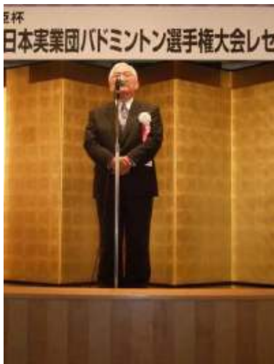
愛知県協会末岡会長挨拶