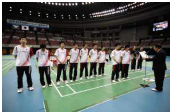
優勝 日本ユニシス