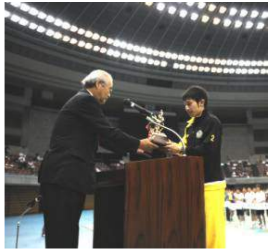
優勝杯返還(男子) トナミ運輸(富山県)