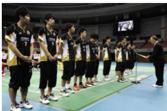
3位 日立情報通信エンジニアリング