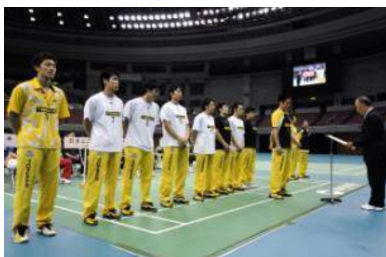
準優勝 トナミ運輸