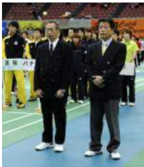
功労者表彰(役員の部)