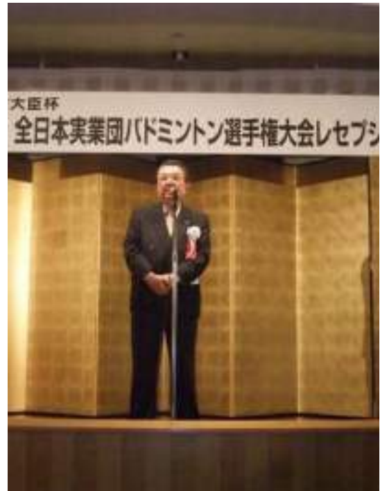
〈公財〉日本協会関根副会長挨拶